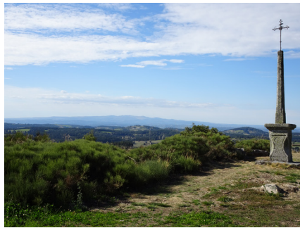
Les Monts du Cantal depuis Termes