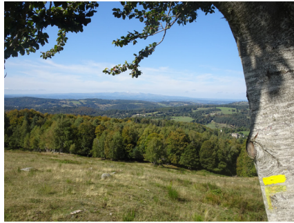
Sous la ferme d'Aussets