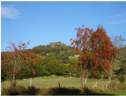
Ambiance de fin d'été