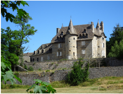
Fournels : Le Château de Brion